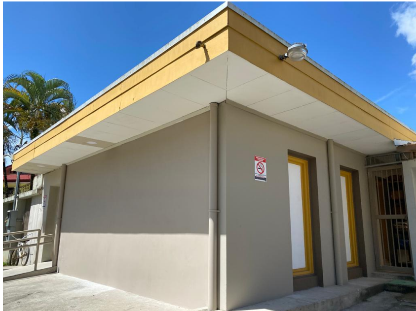
Área remodelada, contiguo edificio principal.