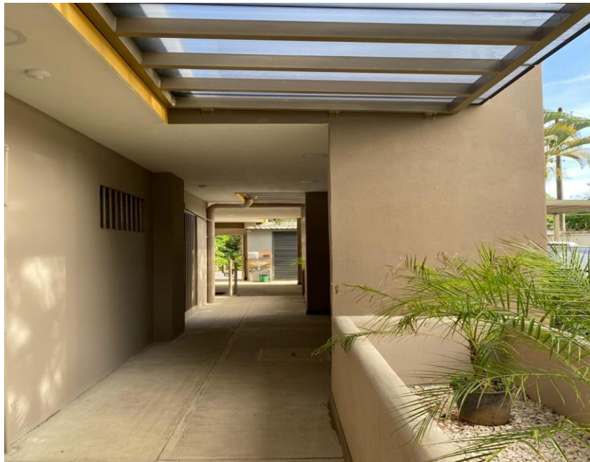
Paso peatonal (otra perspectiva).