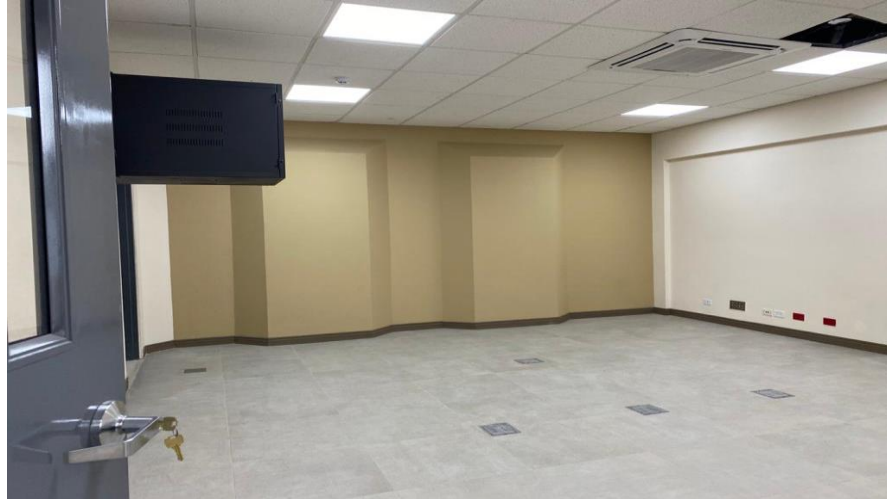
Sala de Juicio.