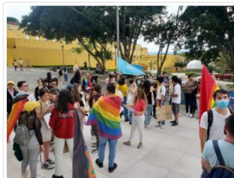
La manifestación se realiza de forma pacífica.

(CRHoy.com) Grupos de la comunidad LGTBI del país realizan una manifestación pacífica frente a la Asamblea Legislativa, en protesta por la defensa que realiza la fracción del Partido Nueva República (PNR) al proyecto de ley que busca prohibir las terapias de conversión para gays en el país.