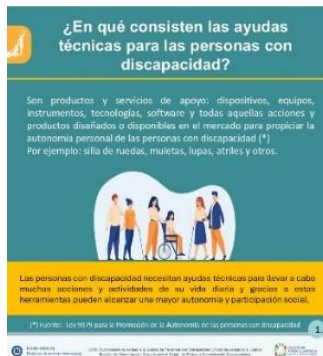
Primera cápsula de la campaña

La campaña consta de cinco cápsulas que se divulgaron durante el período comprendido del 06 al 16 de mayo mediante el correo electrónico institucional a la población judicial.