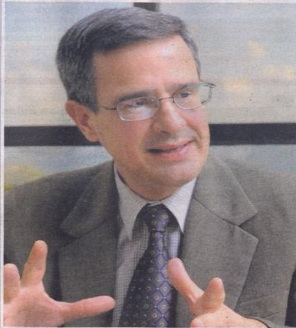
Sobrado: 'Este no es un

Se pronuncian a favor tras conocerse que dos mujeres se casaron porque una de ellas estaba inscrita como varón en el Registro Civil