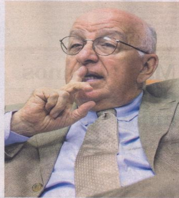
Arguedas: 'Se impondrá